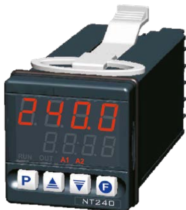
Temporizador Programável - TP01